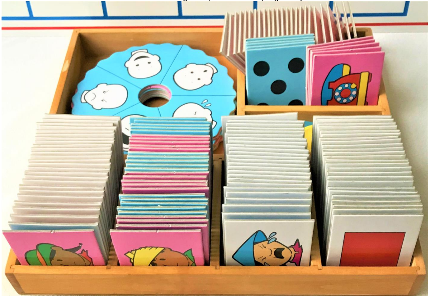
Holztablett mit 140 Legetafeln, 8 Drehscheiben, Magnetknöpfen

(NP ohne Holztablett 84.- bis 87.- Fr) 42 .- Fr.